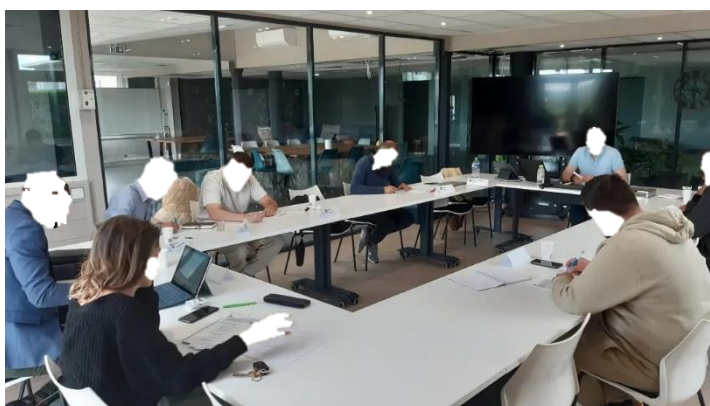
Salle de formation au centre de Saint-Eusèbe