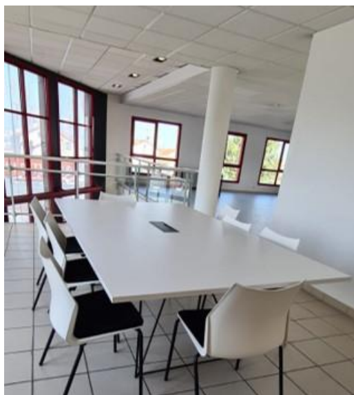
Salle de formation au centre de Clermont Ferrand